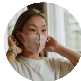
POLLUTION DE L'AIR INTÉRIEUR