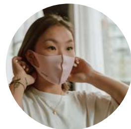
POLLUTION DE L'AIR INTÉRIEUR